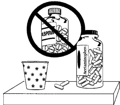
Sawirka 3 aad Ha siinin asbariin. Akhri qoraalka ku qoran daawo kasta kahor intaan siin si aad u ogaato kuurada saxda ah ee loogu.